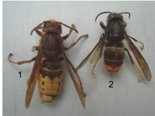
Frelon européen (1) et frelon asiatique (2)

à pattes jaunes. Il construit des nids assez imposants.