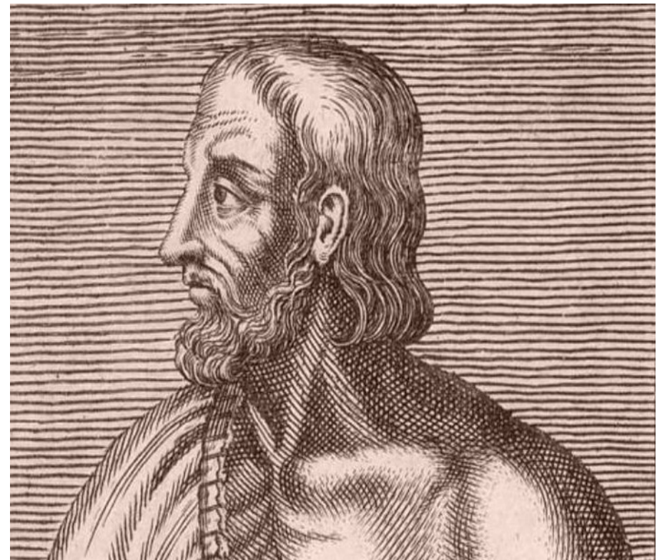
« Portrait » de Foulques Nerra ; la gravure daterait du XVII e siècle