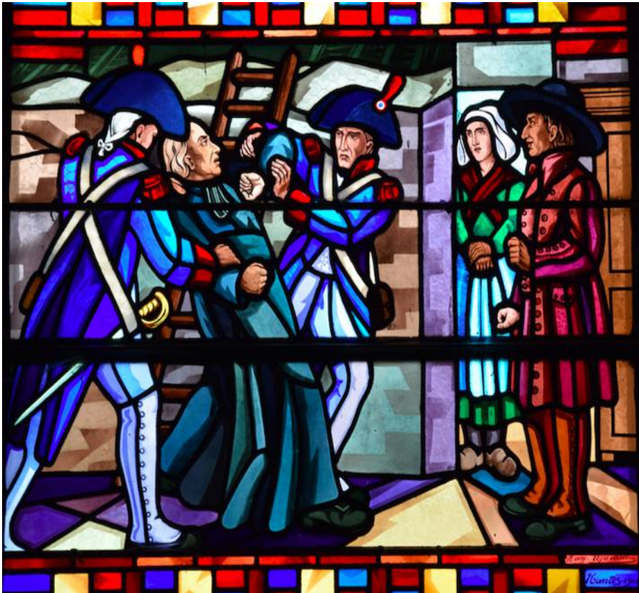
Arrestation de Louis Jumereau. Vitrail (église de Saint-Sulpice)